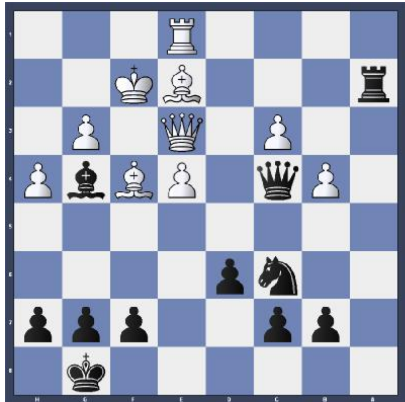
Diagramm 1: Stand nach 38. ---, Dc4, weiß am Zug Diagramm 2: Schluss-Stellung nach 53. ---, Kf5